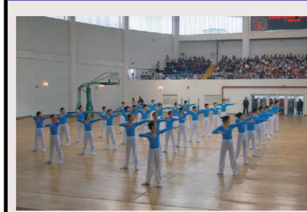
广播操表演 4月18日，我校初一年级代表学校参加了成都市第二届中学生广播操比赛。