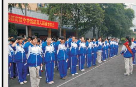
5月4日， 入团宣誓 团委组织了新团员入团宣誓仪式。