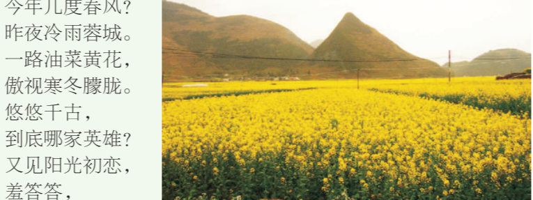
天台山位于四川省邛崃市, 古名东蒙山, 远古洪荒时期, 大禹治水路过蜀国时, 曾选此山为台登高祭天, 故得“天台”之美名。