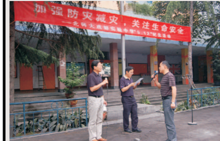
负责人向总指挥报告人数 5月12日上午9时30分，我校举行了“5.12汶川特大地震”周年纪念活动——防灾减灾紧急疏散演习。