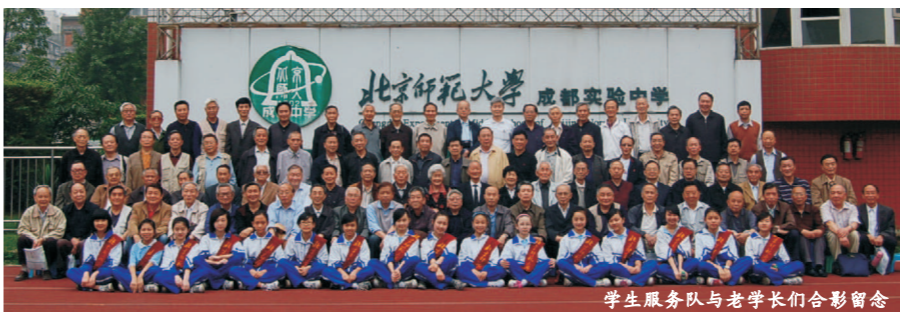
学生服务人员与老学长们合影留念

【办公 讯】5月9日上午，我校高59级（含初34班）校友近百人回到阔别50年的母校举行隆重的同学聚会活动。