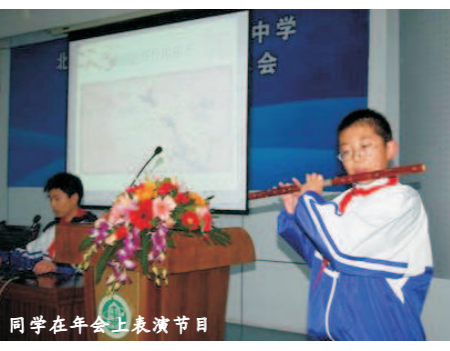
同学在年会上表演节目